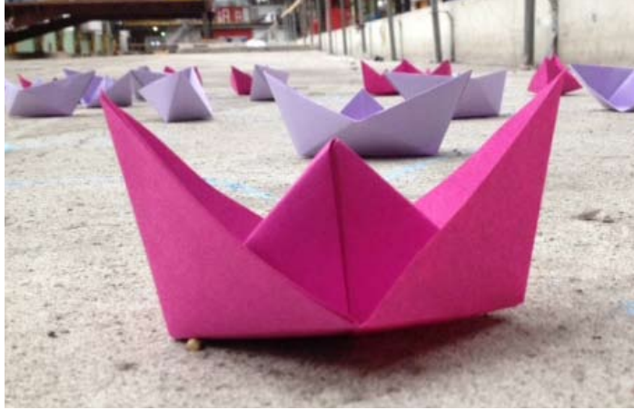
Cities on a drift van kunstenaar Valerie van Leersum, 2015