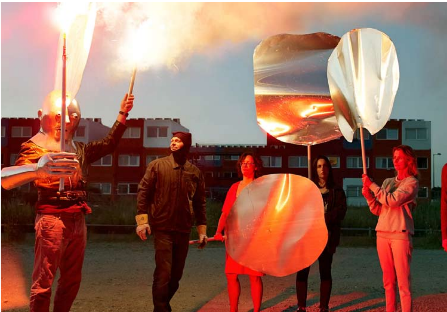
Het Magnetische noorden door kunstenaars Silvie Zijlmans en Hewald Jongenelis, 2015