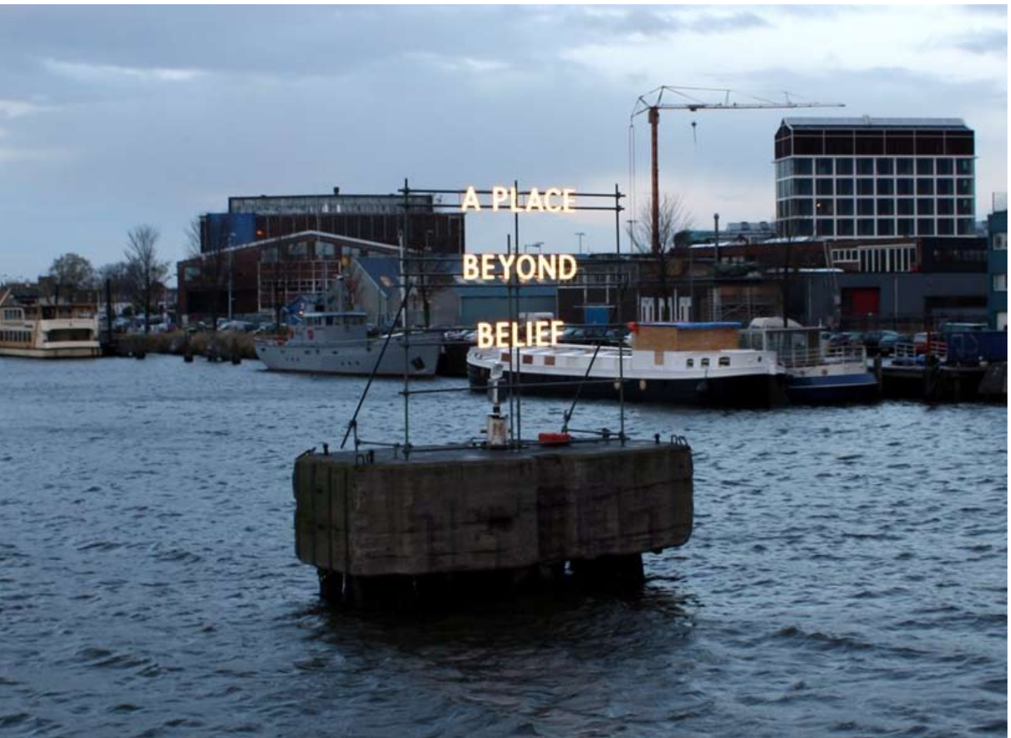
A place beyond belief van kunstenaar Nathan Coley, 2013